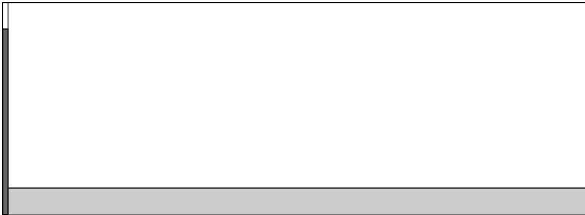
Рис. 3: Применение формулы Байеса в случае теста на ВИЧ. Тонкая полоска слева — люди, зараженные ВИЧ. Темный закрашенный прямоугольник — те из них, кто получил положительный результат теста. Длинный закрашенный прямоугольник справа — здоровые люди, получившие положительный результат теста. Доля больных людей мала по сравнению со всеми людьми, получившими положительный результат.